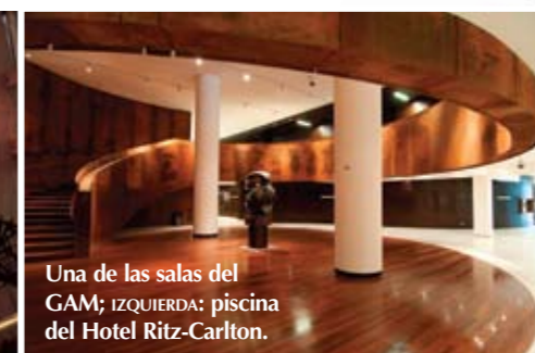
Una de las salas del GAM; IZQUIERDA: piscina del Hotel Ritz-Carlton.