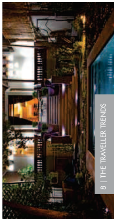
8 | THE TRAVELLER TRENDS

No verão, Santiago é tomada por bicicletas. Um dos circuitos favoritos dos visitantes é o que liga os bairros de Providencia e Bella Vista, que é feito em meio a parques, com a cordilheira ao fundo.