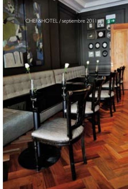
CHEF&HOTEL / septiembre 2011